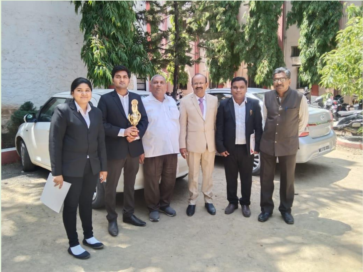
New Law College Ahmednagar, Justice S.B. Mhase Fourth State Level Moot-Court Competition, 2021-2022 Win Moot Court Competition