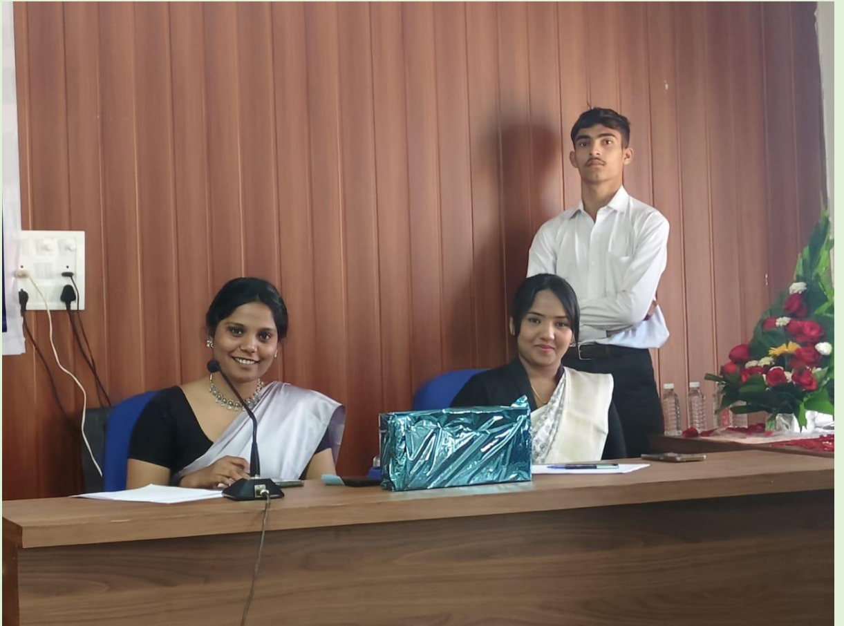
Organising event Nagsenvanacha Mahavakta