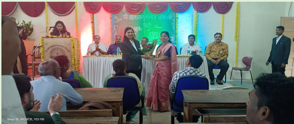
Teachers' Day Celebration by Students