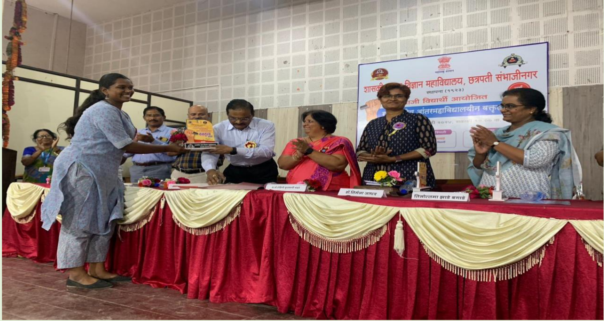
Government College of Arts and Commerce- Elocution Competition- 1st prize